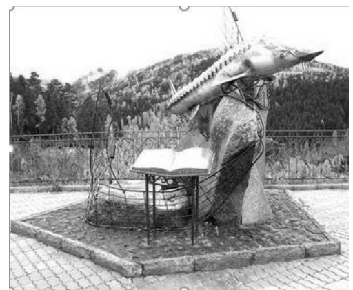
Красноярск. Памятник повести В.П. Астафьева «Царь-рыба».