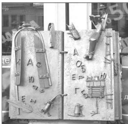
Новокузнецк. «Книга – источник знаний»