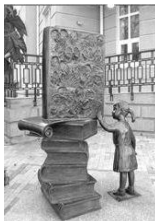
Таганрог. Перед городской библиотекой